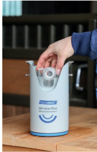
Abb. 3 Nebulkammerdeckel aufsetzen.