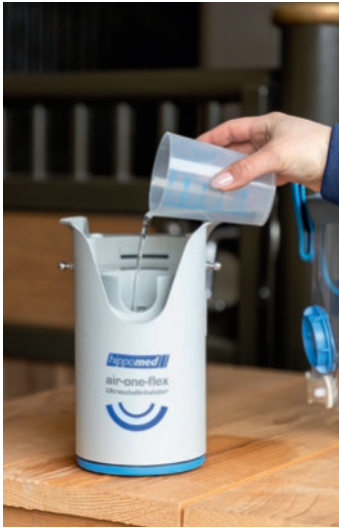
Abb. 1 Kammer 1 mit Kontaktflüssigkeit befüllen.