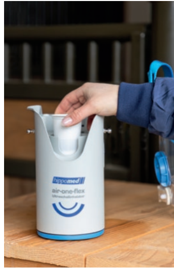
Abb. 2 Kammer 2 (befüllt mit Inhalat) einsetzen.