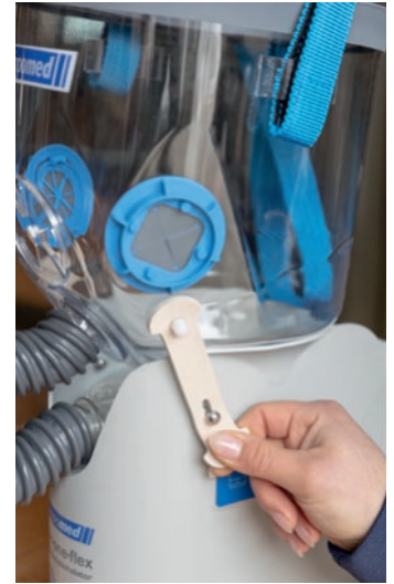
Abb. 4 Maske mit Gummilaschen befestigen und Verbindungsschlauch aufstecken.